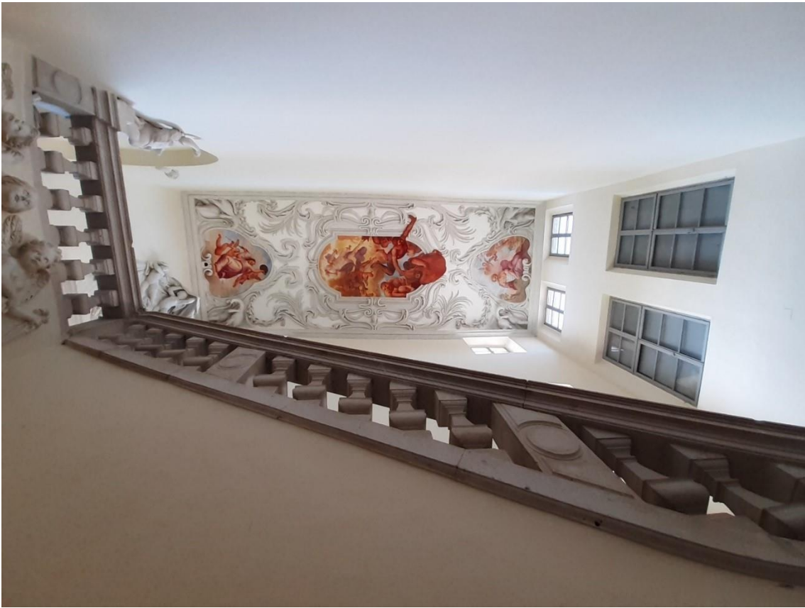
Scalone monumentale di ponte di Villa Manin