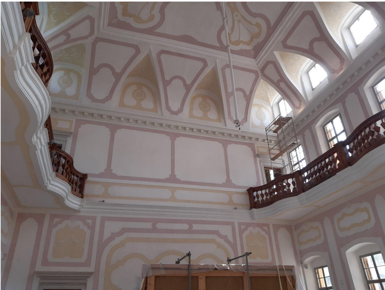
Salone centrale Villa Manin

Maggiori informazioni sull'associazione Amici delle Ville Venete sono disponibili a questo link https://www.giornatavillevenete.it/grand-pass/