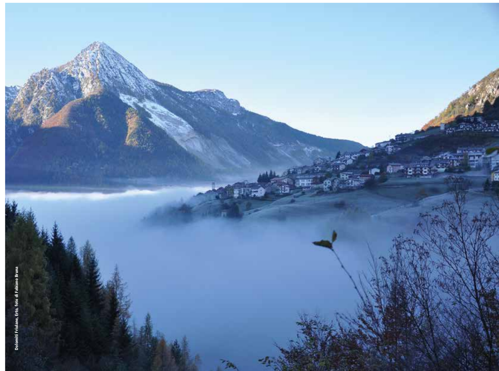
Dolomiti Friulane.

14/15/16 OTTOBRE 2021 - FORNI DI SOPRA, TOLMEZZO (UD)