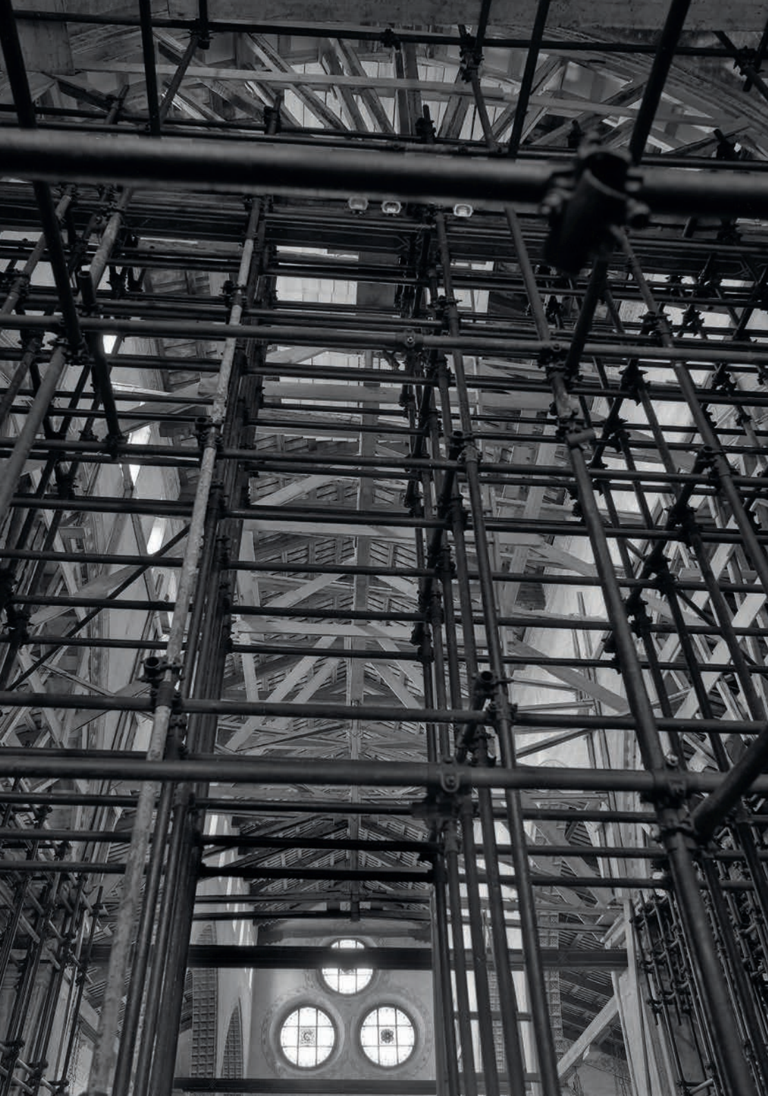
Interno del Duomo di Spilimbergo, 1976